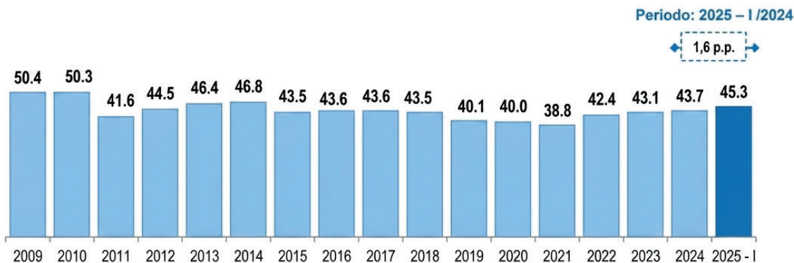
Figura 1. Prevalencia de anemia en niños de 6 a 35 meses de edad, Perú, 2009–2025 (primer semestre).