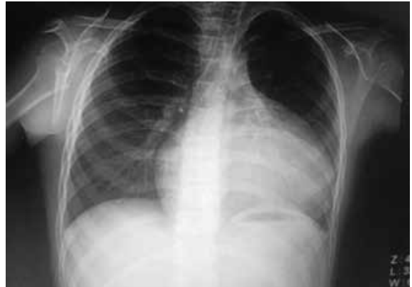
Figura 1: Cardiomegalia de predominio izquierdo. Leve obturación de senos costofrénicos. Campos pulmonares neumatizados. Vasculatura pulmonar parenquimal de aspecto habitual.

(fig. 1) y EKG (fig. 2) tomados en la emergencia. Tratamiento recibido: Amiodarona: 5 mg/Kg por infusión cada 12 h, luego 115 mg vía e.v 1 vez al día por 2 días; asociado a dosis única de Furosemina: 30 mg vía e.v. Con evolución clínica favorable, es dado de alta a las 48 h con amiodarona 120 mg vía oral c/12h por 4 días y posterior control ambulatorio.